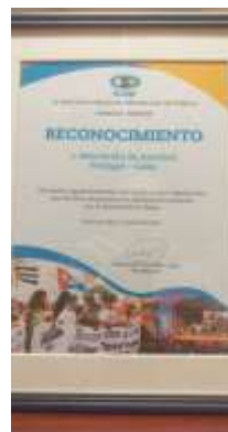
Reconhecimento do ICAP