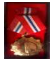
Medalha "Ordem de la Solidaridad"