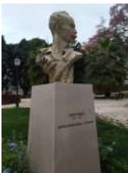
Busto de José Martí colocado na Praça da Alegria em Lisboa