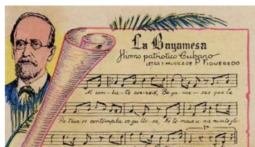
Hino Nacional de Cuba